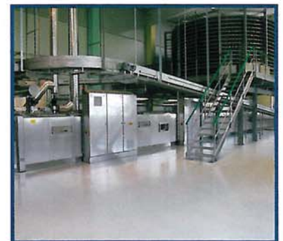
Der Thermoöfentunnelofen von Daub. Vor dem Backen können Brote durch ein ausfahrbares Band manuell nachbearbeitet werden.

Optimal ist es für den Einsatz eines kontinuierlichen Knetsystems, wenn der Backplan eines Tages nur helle oder nur dunkle