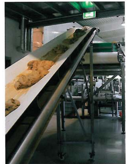
Übergabe des Roggenteiges an das Teigruheband. Platzsparend wurde es über Teilen der Aufarbeitungslinie platziert.

Warm- und Eiswasser gemischt. Dabei regelt die Anlagensteuerung je nach der gewünschten Teigtemperatur automatisch die erforderliche Wassertemperatur. Die zwei speziellen, spiralförmigen, ineinander greifenden Mischwerkzeuge sorgen für eine gründliche, schonende Durchmischung und für eine optimale Benetzung aller Rezepturbestandteile. Bereits beim Mischen ergibt sich eine perfekte Hydratisierung des Mehls, sodass die biochemischen Prozesse unmit-