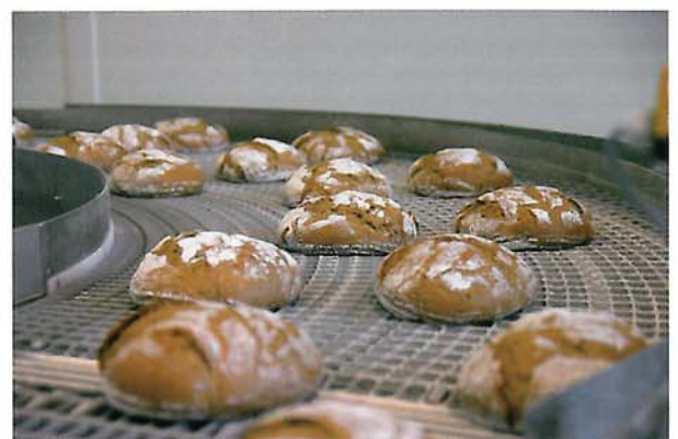
Gleichmäßige Qualität: Die vorgebackenen Brote zeichnen sich durch eine gleichmäßige Form und Farbe aus.