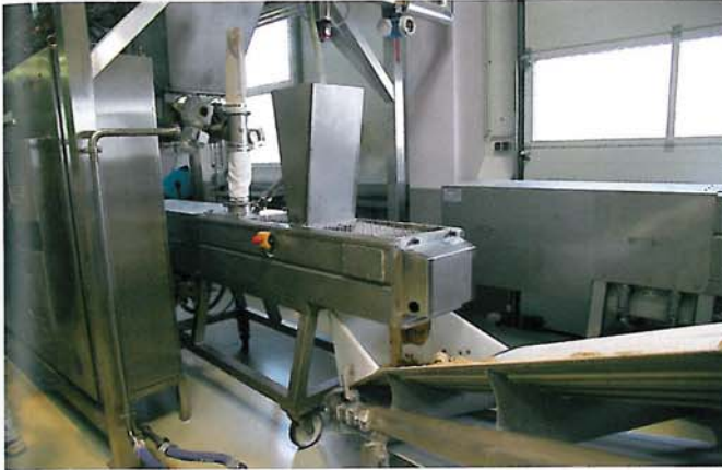
Die Backwelt Pilz nutzt allein den CodosMischer zur Herstellung der Roggenbrotteige, da diese nur eine intensive Mischphase benötigen.

te er aber das Potenzial eines kontinuierlichen Knetsystems für seine Produktion.