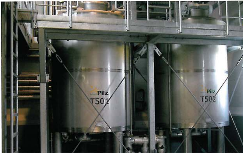
Die Backwelt Pilz stellt alle Brote nur mit Natursauerteig her.

zum Beispiel über dem Bereich der Brotaufarbeitung, so dass die Anlagenführer bequem darunter her gehen können.