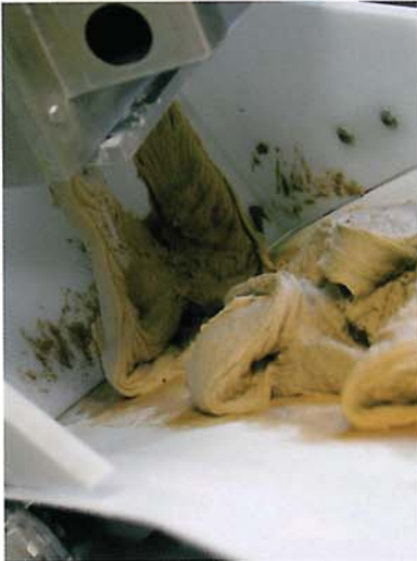
Austrag eines gut gekneteten Roggenteiges. Die restliche Teigentwicklung findet auf dem Teigruheband statt.

trockenen Klein- und Großkomponenten und vermischt sie anschließend. So werden die Rohstoffe im Vorfeld homogenisiert. Dieser Mix wird dann im CodosMischer mit den flüssigen Komponenten im exakt definierten Verhältnis zusammengefügt. Dies gilt auch für die Integration von Vor- und Sauerteigen.